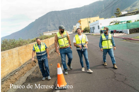
Paseo de Merese Artero

La Frontera continúa avanzando en su Plan de Mejoras Municipales con la ejecución de diversas actuaciones orientadas a reforzar la seguridad, la accesibilidad y la calidad de vida de los vecinos y vecinas. Este conjunto de intervenciones responde tanto a necesidades detectadas por la institución como a demandas realizadas por la ciudadanía.