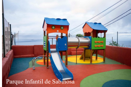
Parque Infantil de Sabinosa

A esta mejora se suma el embellecimiento del jardín de Las Puntas, con una inversión de 16.047,86 euros, contribuyendo a mejorar la imagen de uno de los principales accesos al municipio. En materia de movilidad, el Ayuntamiento ha iniciado también la construcción de