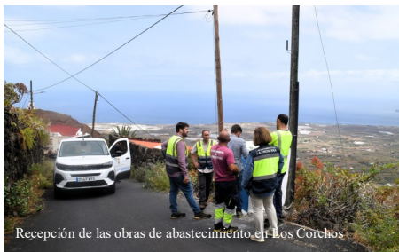
Recepción de las obras de abastecimiento en Los Corchos

A esta actuación se suma también la finalización de la obra de “Mejora de la Red de Abastecimiento de Agua Potable del Núcleo de Sabinosa”, que contó con una inversión de 147.455,85 euros. Una obra planificada para dar respuesta a la necesidad de solventar las deficiencias detectadas en el servicio, especialmente durante los meses de mayor demanda, y garantizar un suministro continuo tanto a Sabinosa como al Pozo de La Salud.