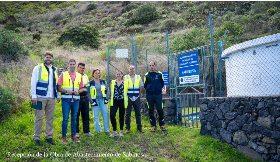
Recepción de la Obra de Abastecimiento de Sabinosa

El Ayuntamiento continúa avanzando en la modernización y mejora de la red municipal de abastecimiento de agua potable con dos actuaciones clave desarrolladas en las zonas de Los Corchos y Sabinosa, que suponen una inversión conjunta superior a los 165.000 euros.